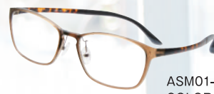
ASM01-1512 / COLOR ●●●●