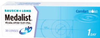
ポシュロム メダリストワンデープラス