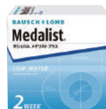
ポシュロム メダリストプラス