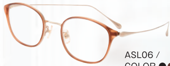
ASL06 / COLOR ●●●●